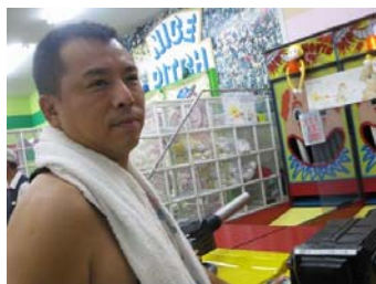
↑ゲームして満足した僕